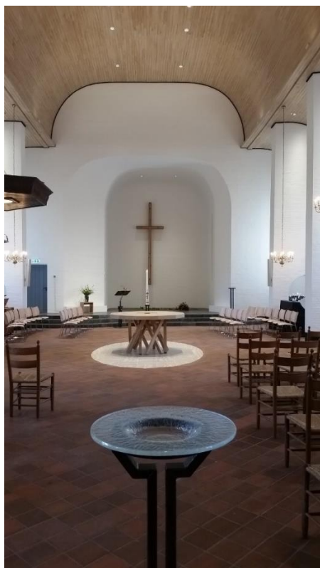
Start van pelgrimage bij doopvont

'Een: omarm die poëtische omgang met je heilige teksten. En twee: sluit aan bij de notie dat de vervulling van het individu alleen gevonden kan worden als lid van een gemeenschap. We leven in experimentele tijden: nooit eerder stond het individu zo centraal. Het is zeer de vraag of dat zo blijft. Want de geschiedenis is er glashelder over: het gaat niet om jou, het gaat om de gemeenschap'. Dit brengt ons bij de 'communio'.