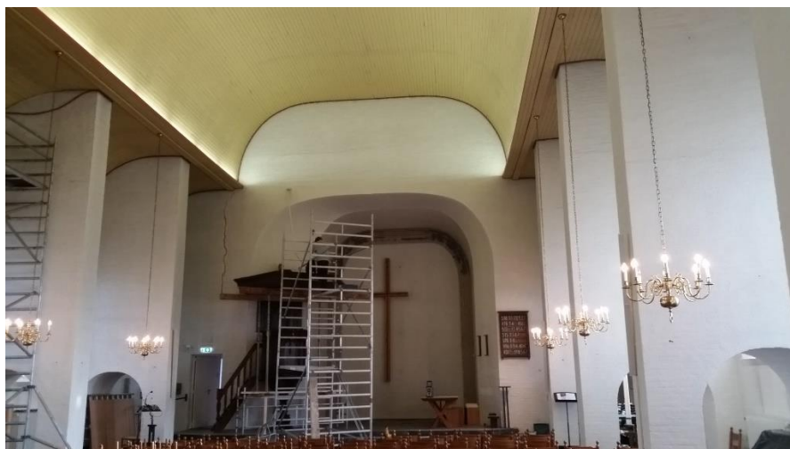
Steigers in de kerk

In 2013 formeerden we een groepje om na te denken over welke kleur blauw mooi zou zijn voor het gewelf. Daarnaast wilden we nadenken hoe we qua inrichting en licht meer rust zouden kunnen creëren onder het motto: terug naar de eenvoud. Het oorspronkelijke ontwerp van David Zuiderhoek vonden we nog altijd mooi, maar deze was in de loop der tijd 'bedolven' geraakt onder allerlei toevoegingen, zoals haakjes, snoeren, stekkers, stoelen en tafels.